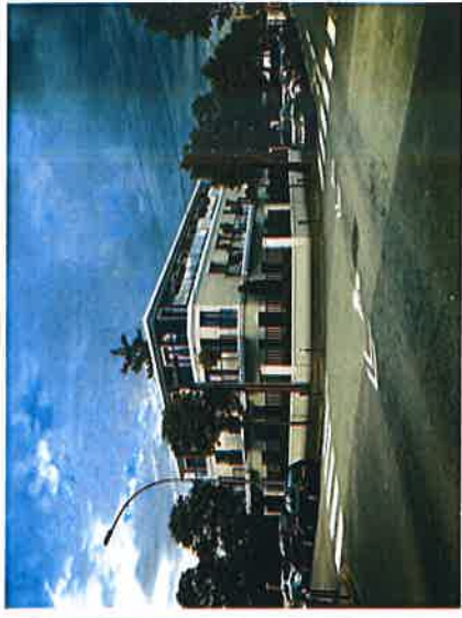
Construction de 12 logements